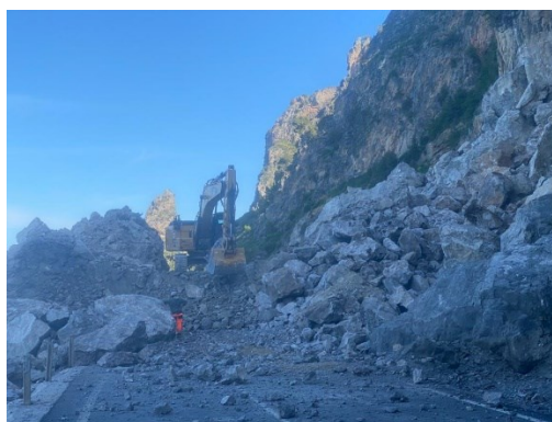
Lavori di sgombero con mezzi meccanici