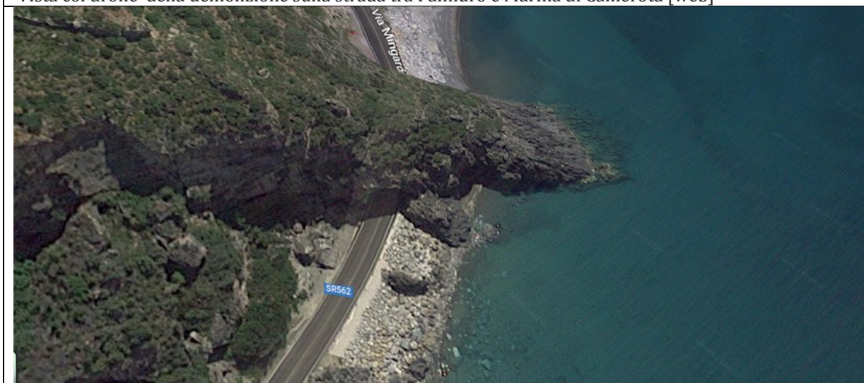
Il tratto stradale prima della demolizione