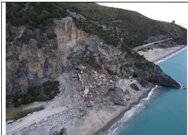
Vista col drone della demolizione sulla strada tra Palinuro e Marina di Camerota [web]

ASSOCIAZIONE NAZIONALE PER LA TUTELA DEL PATRIMONIO STORICO, ARTISTICO E NATURALE DELLA NAZIONE SEZIONE CILENTO-LUCANO