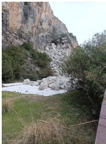
massi da esplosione