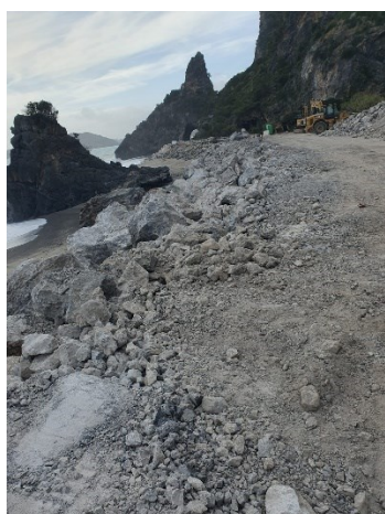
Carreggiata con massi dopo l'esplosione